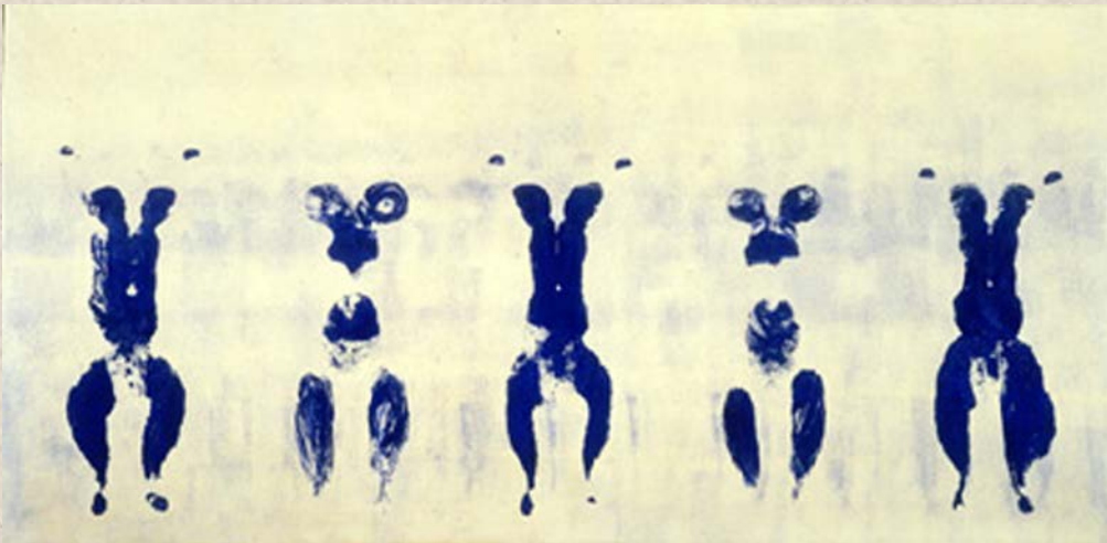
Yves Klein - Antropometrie

8 GIUGNO – 9 SETTEMBRE – 28 SETTEMBRE – 19 OTTOBRE – 9 NOVEMBRE - 21 DICEMBRE 2023